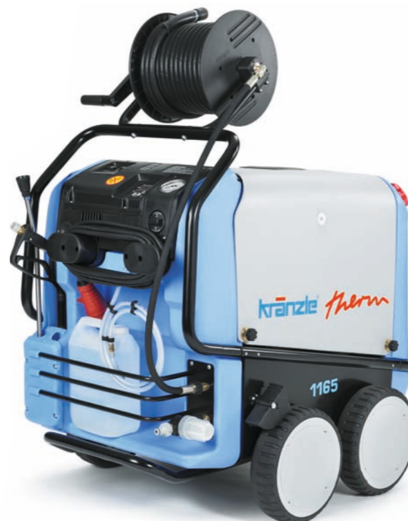
Therm 8951 T