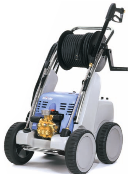
Quadro 1200 TST